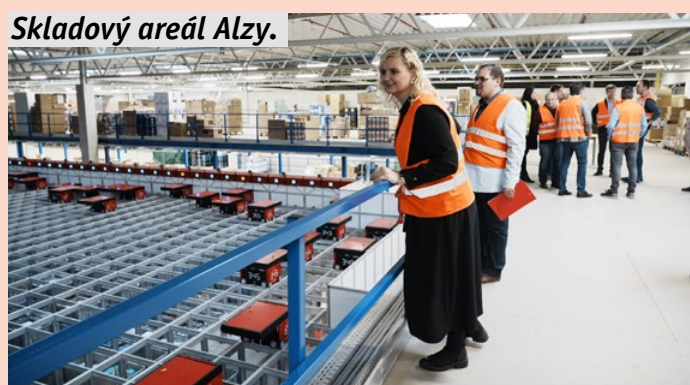
Skladový areál Alzy.