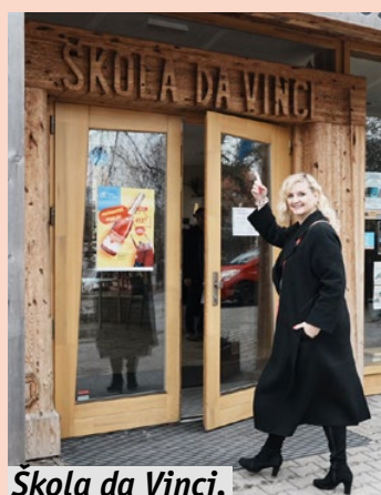
Škola da Vinci.

Návštěvu vedení Středočeského kraje ukončilo v Černošicích, a to setkáním s okolními starosty a debatou s občany v městském sále.