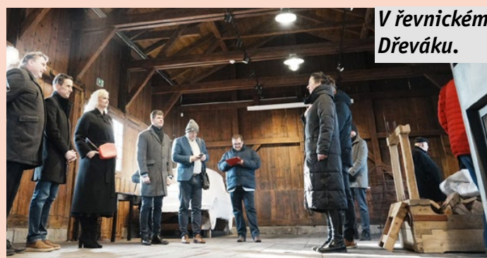
V řevnickém Dřeváku.