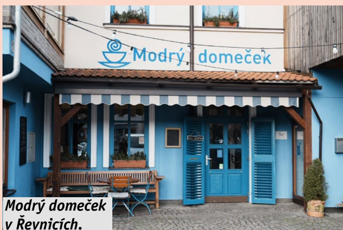
Modrý domeček v Řevnicích.