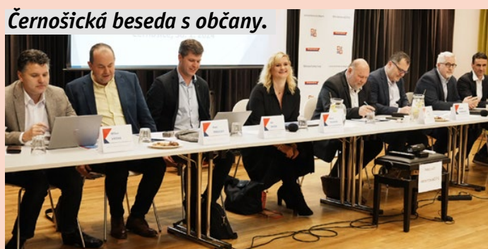
Černošická beseda s občany.