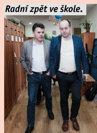
Radní zpět ve škole.