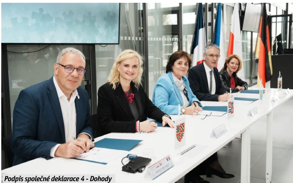
Podpis společné deklarace 4 - Dohody

Ve vědeckém centru Eli Beamlines v Dolních Břežanech zástupci regionů podepsali Společnou deklaraci 4 – Dohody v oblasti technologie, vědy a výzkumu, ve které se zavazují k posílení vzájemné vědecké spolupráce. „Letošní setkání jsme zaměřili na vědu a inovace, představili jsme partnerům naše Středočeské inovační centrum a vědecké