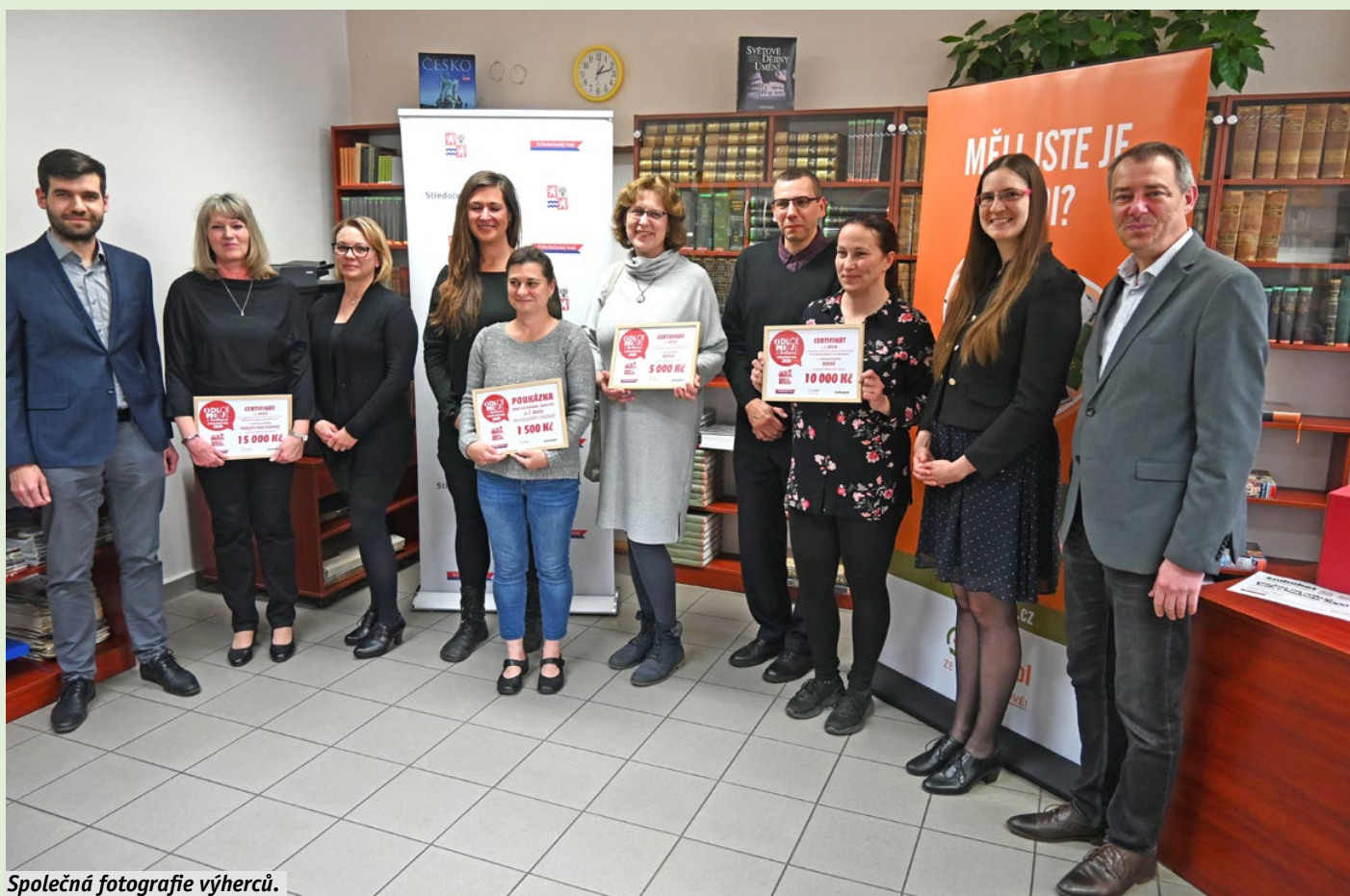
Společná fotografie výherců.

Hodnotné ceny v podobě poukázek na nákup knih od společnosti Knihobot získají i čtenáři, kteří k odevzdanému mobilu připojili kontaktní údaje a měli štěstí při losování. Další necelá stovka vylosovaných čtenářů, kteří se do sběru zapojili, obdrží volné rodinné vstupenky do galerií a muzeí v kraji. Seznam výherců je zveřejněn na stránkách www.odlozmobil.cz .