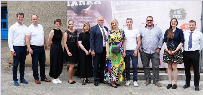
Jednou ze zastávek červnového výjezdu byla i Biopekárna Zemanka.