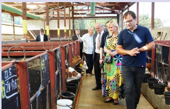
ZD Krásná Hora nad Vltavou a.s. specializuje na živočišnou výrobu.

Výjezd do Sedlčan a okolí byl posledním, které současné vedení kraje podniklo, tím navštívilo všech 26 správních obvodů obcí s rozšířenou působností. Těšíme se na vás na dalších místech Středočeského kraje!