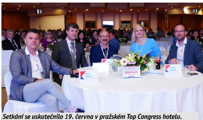
Setkání se uskutečnilo 19. června v pražském Top Congress hotelu.

Několik desítek ředitelů příspěvkových organizací se sešlo s vedením Středočeského kraje v pražském Top Congress hotelu. Během konference se věnovali praktickým tématům - jako je novela zákoníku práce, metodická podpora příspěvkových organizací, památkové péči s ohledem na správu majetku či umělé inteligenci. Setkání zahájila hejtmanka Petra Pecková, která ocenila pravidelný kontakt a úzkou spolupráci se všemi zúčastněnými. Sama hejtmanka poté shrnula úspěchy kraje a problematiku rozpočtového určení daní. Vystoupili rovněž další členové Krajské rady. O rozpočtu promluvil náměstek pro oblast financí a dotací Michael Kašpar, radní pro oblast majetku a investic Libor Lesák popsal průběh pasportizace majetku a energetické úspory na našich stavbách a udržitelnosti se věnovala radní pro životní prostředí a zemědělství Jana Skopalíková. Na setkání s příspěvkovými organizacemi vystoupil také ředitel Krajského úřadu středočeského kraje Honza Louška společně se svojí zástupkyní Pavlou Katzovou. Ve svém příspěvku se věnovali metodické podpoře a řízení PO, veřejným zakázkám, ale rovněž také krajským investicím.