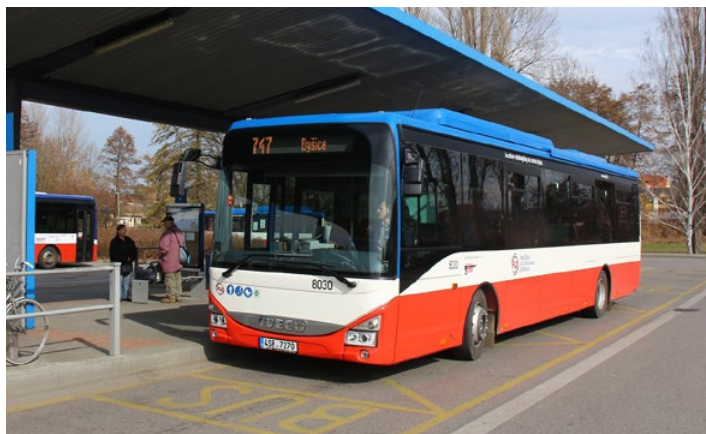
Linka 747 obsluhující Byšice.

Kraj k náhradě vlaku za levnější autobusový spoj přistoupil po zhodnocení výsledků z periodického průzkumu počtu cestujících. Nyní místo vlaku tedy jezdí autobus linky 747 s odjezdem ze zastávky Byšice ve 4:07 hod. „Tímto krokem došlo nejen k finanční úspoře, neboť souprava pro vlak musela být vedena ze Všetat v režimu