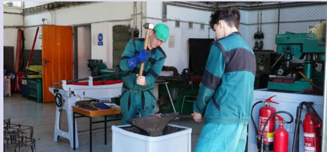
Radní navštívili také Střední odborné učiliště v Sedlčanech.

Další zastávkou byla Biopekárna Zemanka. Ta vznikla v roce 2006 jako rodinná firma zaměřující se na řemeslné pečení. Dnes má firma více