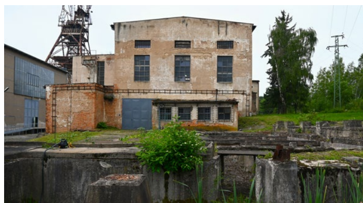
Areál bývalého uranového dolu Bytíz u Příbrami.

Nově otevřena je také venkovní výstava o účastnících protinacistického odboje, kteří byli po válce vězněni v uranových táborech na Příbramsku. Na panelech jsou kromě plánů, náčrtů a dobových dokumentů také konkrétní jména a osudy odsouzených. Většinou se jedná o hrdiny, kteří bojovali proti fašismu na západní frontě nebo v řadách britské RAF. Slavnostního přestřžení pásky se