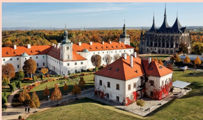
Sídlo GASK se nachází v bývalé jezuitské koleji, jedné z hlavních architektonických dominant historického centra Kutné Hory

Nabídková cena vybraného dodavatele je 6 milionů korun. Nové bistro by mělo být pro návštěvníky otevřeno od listopadu letošního roku.