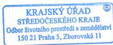
Ing. Pavel Visinger odborný referent oprávněná úřední osoba

Ve stanoveném záplavovém území vodoprávní úřad stanovuje omezující podmínky ke stavbám, zařízením nebo činnostem, které mohou ovlivnit vodní poměry ( nejčastěji v rámci řízení o udělení souhlasu podle § 17 vodního zákona ).